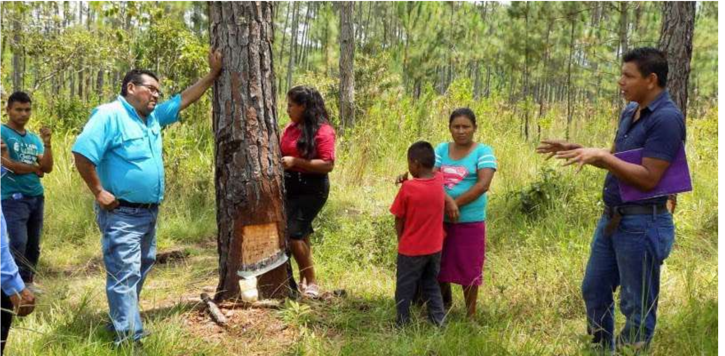
Empresa de Servicios Múltiples Voluntad y Acción Juvenil EVAJ

El fortalecimiento lingüístico y cultural del 80% de la población joven Pech, mediante un convenio con el consejo de ancianos, la comunidad y los maestros, para bio-alfabetizar los conocimientos tradicionales de medicina, gastronomía Pech, técnicas de siembra y preservación de los recursos naturales.