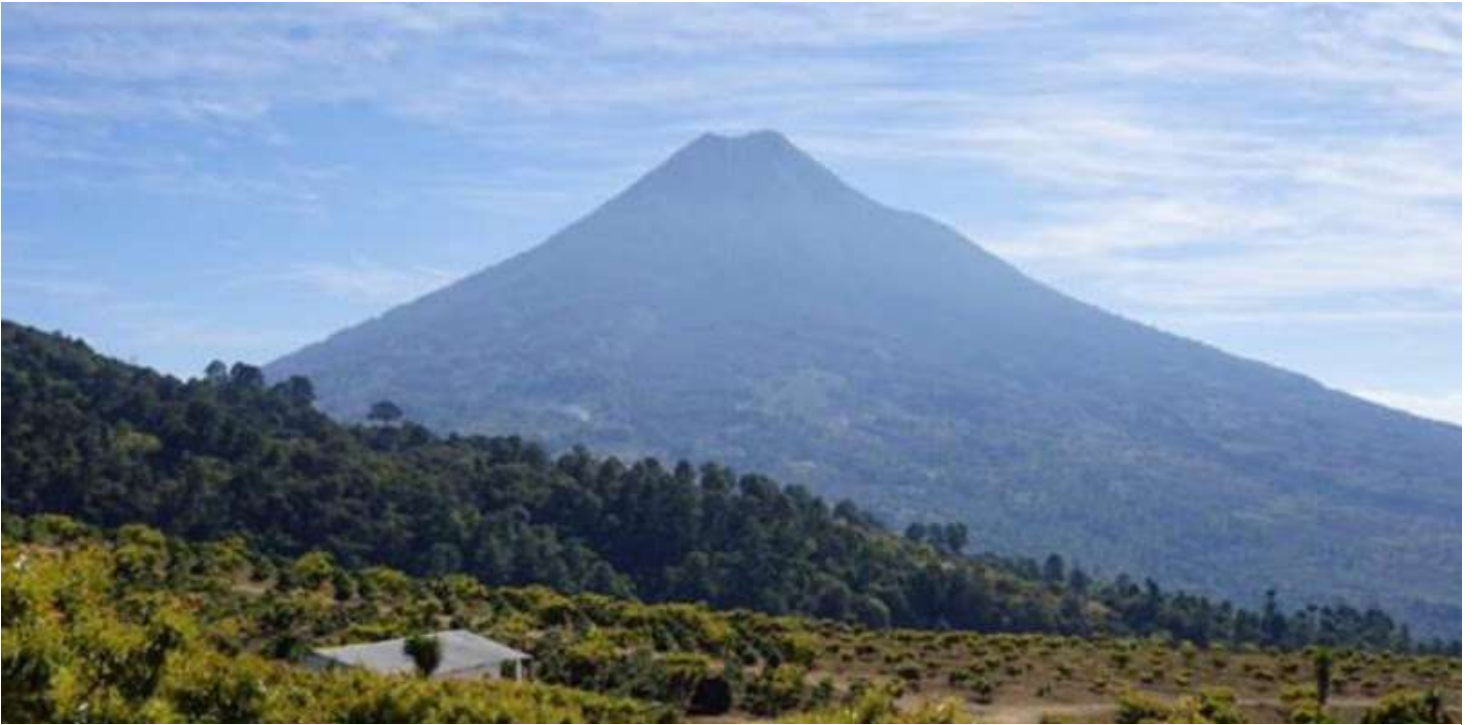
Cooperativa Senderos El Alto

Taller Regional Virtual Inicio Manuales Agenda Día I Agenda Día II Posters Grandes atractivos para los visitantes, se realizará la publicidad que pueda visualizar el nuevo proyecto del "pueblo Jardín" de esta manera se pretende aumentar en un 10% el turismo en la comunidad que generará ingresos por la entrada de los visitantes, pero también por la venta de productos de los comunitarios.