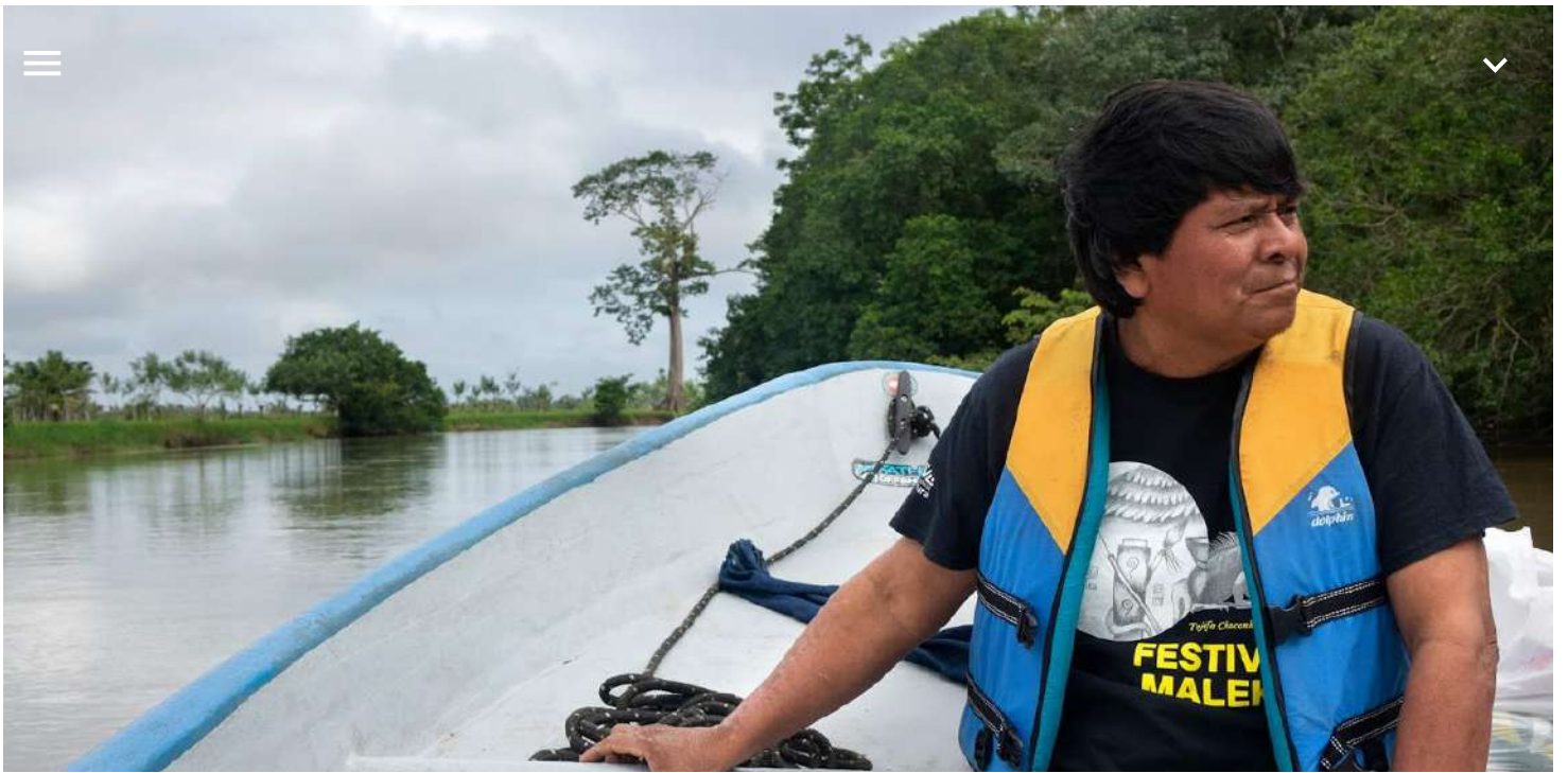
Asociación para la Promoción y Rescate de Tradiciones Culturales Maleku