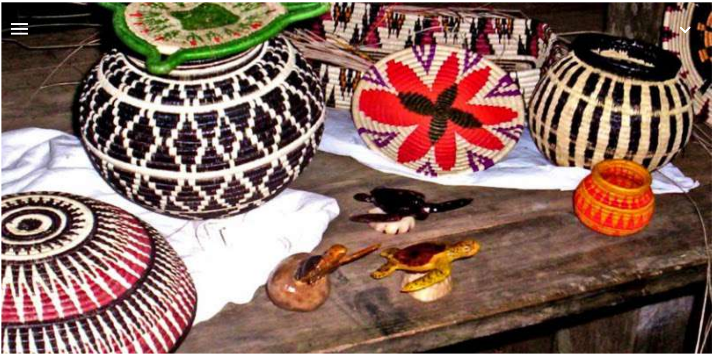
Asociación de Mujeres la Unidad de Río Chico