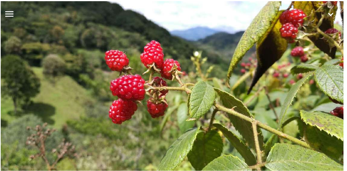
Asociación de Desarrollo Comunal del Jardín de Dota