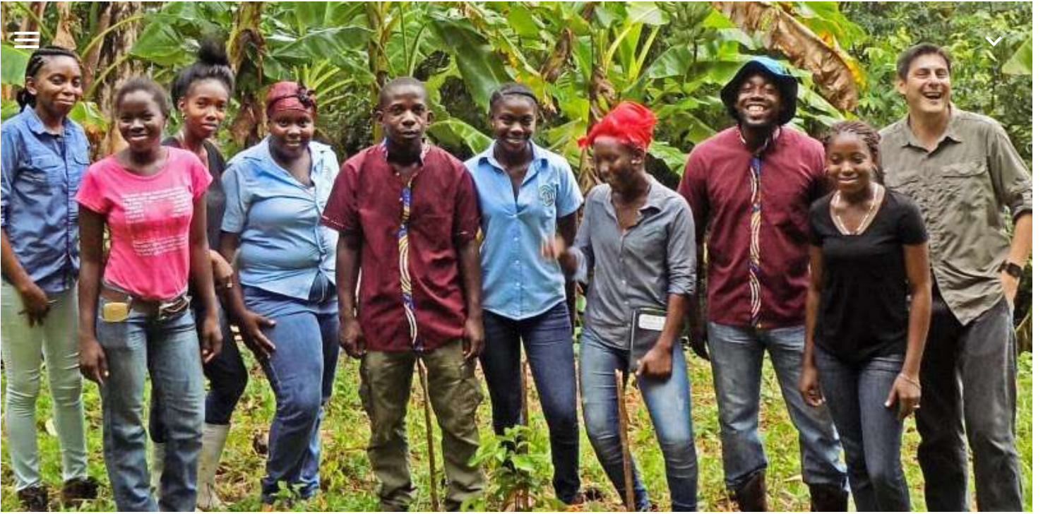
Empresa de Jovenes Esperanza Juvenil Hemenigui Nibureitiña