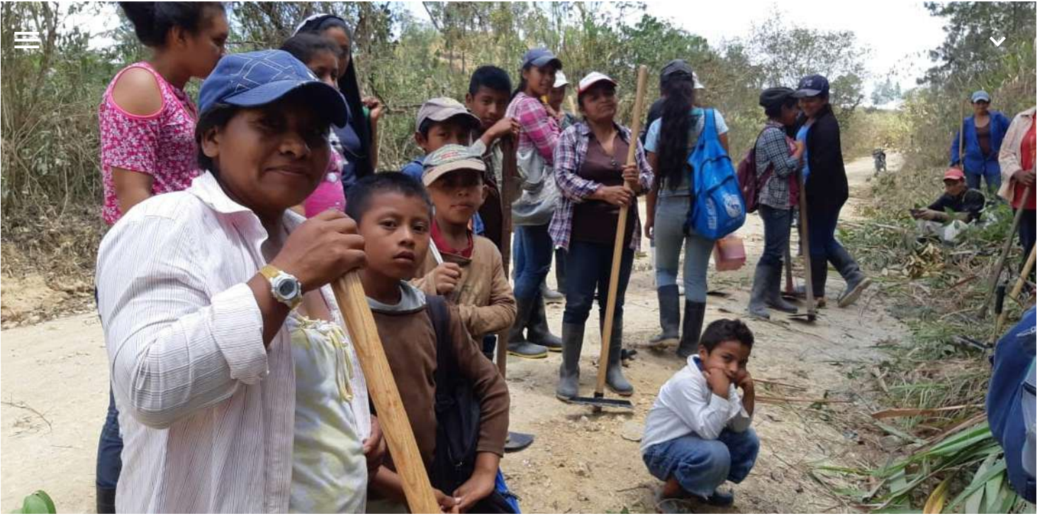
Consejo de Tribu de Culuco