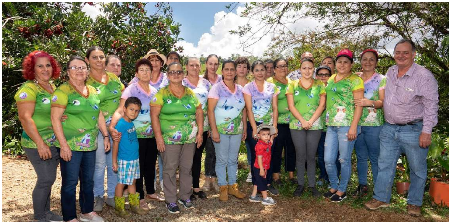
AMACOBAS: Asociación de Mujeres Activas del Corredor Biológico Alexander Skutch

Se se recibe la vista de turismo vivencial, desde que inicia la faena hasta los productos finales.