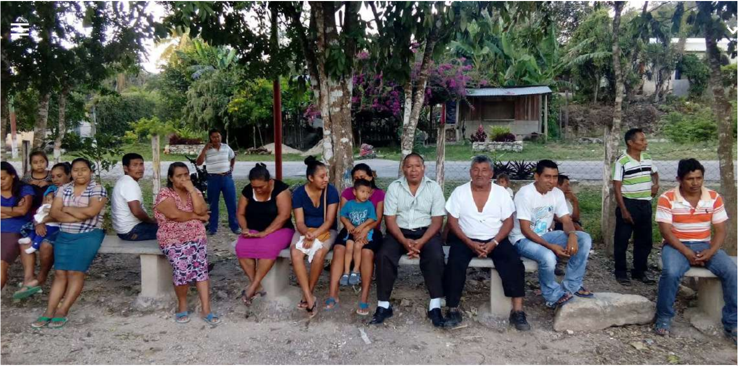
Sociedad Civil para el Desarrollo Árbol Verde