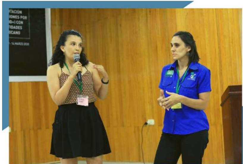
EXPOSICIÓN DE TRABAJO GRUPAL