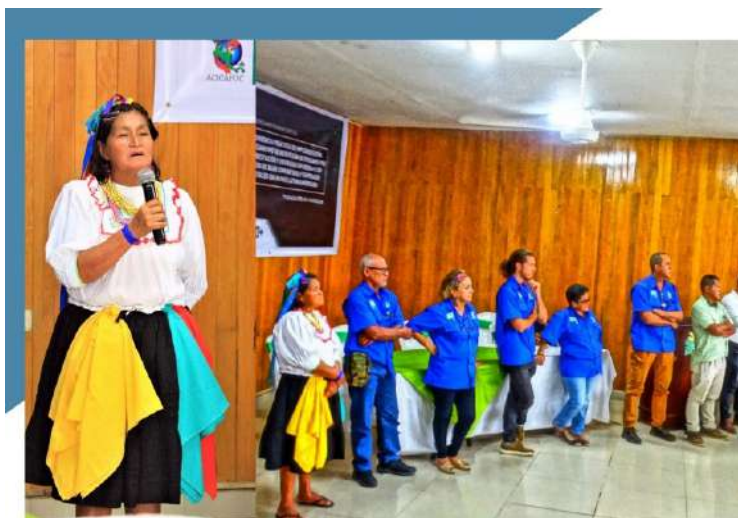
PRESENTACIÓN DE PARTICIPANTES

Se contó con la participación de 61 participantes, todos ellos, fueron presentados siguiendo una dinámica popular de hacer un círculo y compartir su nombre, organización representada y las expectativas del taller. (Ver Anexo 2 con la lista de participantes).