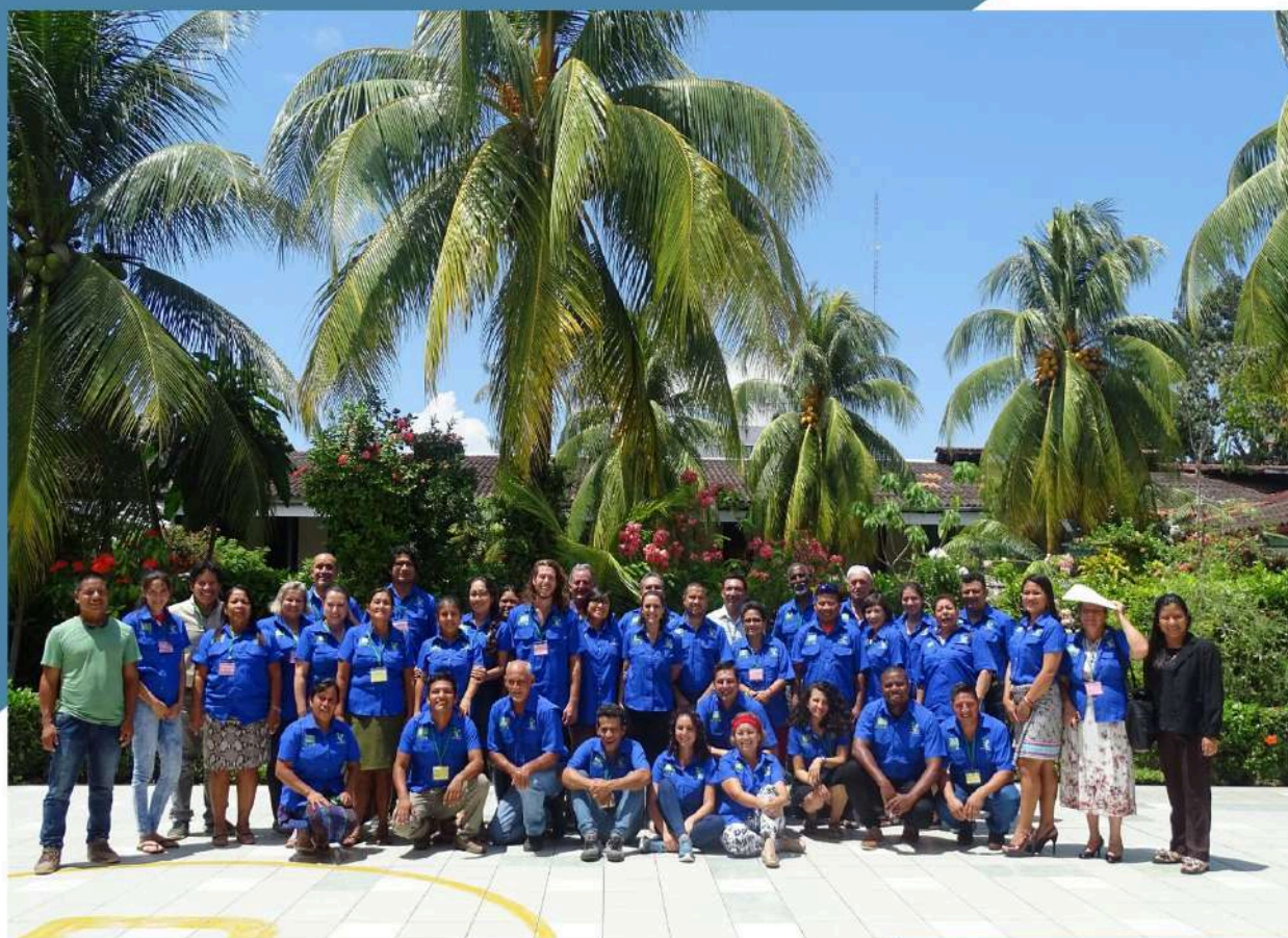
PARTICIPANTES DEL TALLER