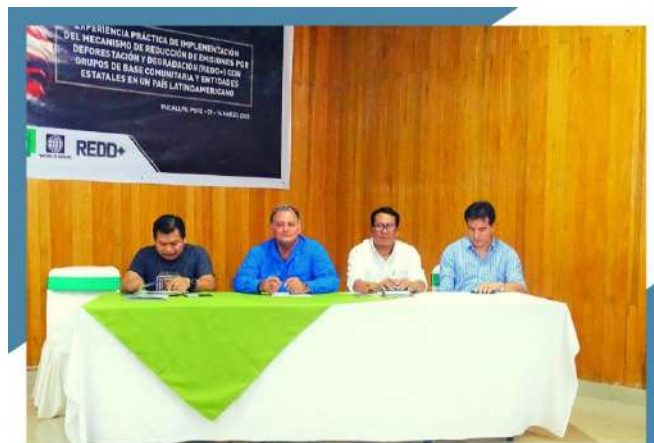
MESA DE HONOR